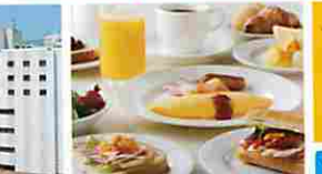
朝食付プランは、朝食付タイプです。