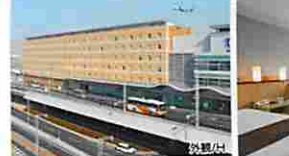
レディースルームも同じ様式となります。