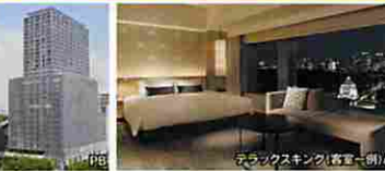
デラックスキング(客室一例)