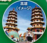
高雄(イメージ) 台北・基隆・九份・日月潭/ 花蓮・高雄・台南・台中 の名所をめぐる!!

新北投 陽明山 名湯めぐり 台北 高雄 花蓮 湯けむり&北海岸紀行 台湾3大都市めぐり 台湾観光の決定版!! 台湾をぐるっと一周!! 台湾大周遊 6日間