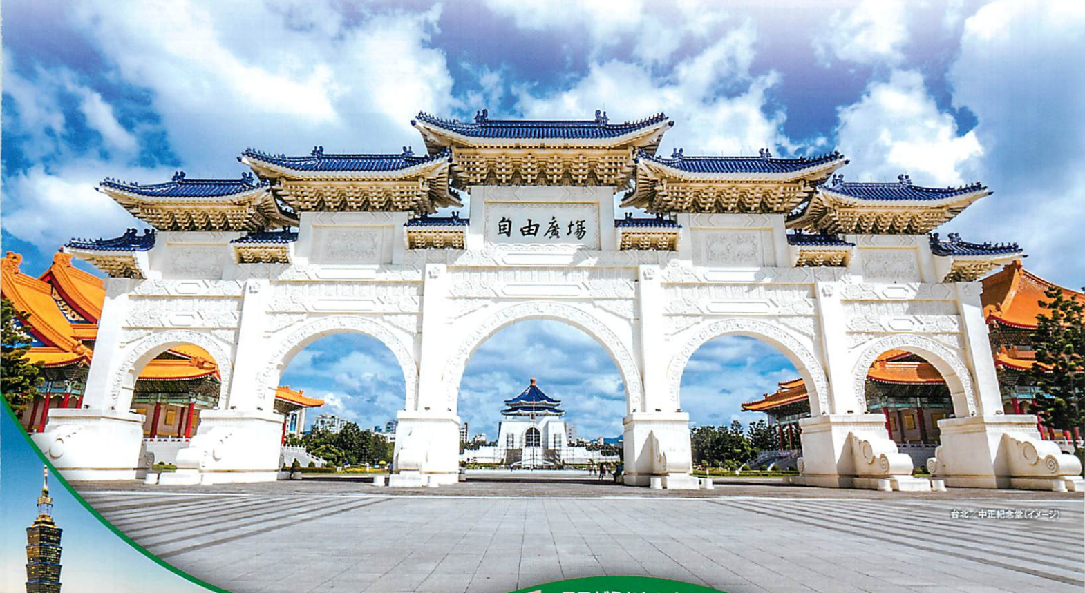
台北・中正紀念堂(イメージ)

台北 / 台中 / 台南 / 高雄 花蓮 / 九份 / 基隆 / 淡水 野柳 / 陽明山 / 日月潭