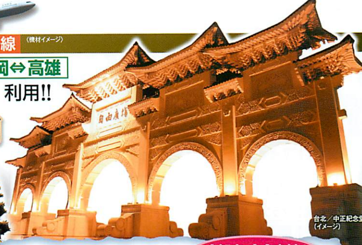
台北・中正紀念堂(イメージ)