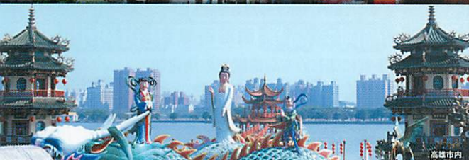
高雄南内(イメージ)