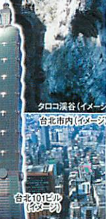
クロコ峡谷(イメージ)