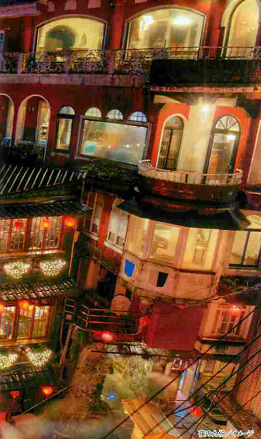
夜の花燈籠/イカダ