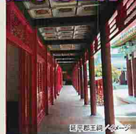
延平郡王祠/イメージ